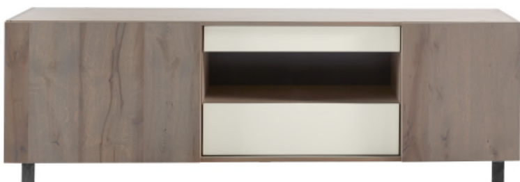
081 Dressoir H60 x B213 x D50 cm

Het wandmeubel is samen te stellen uit losse onderdelen