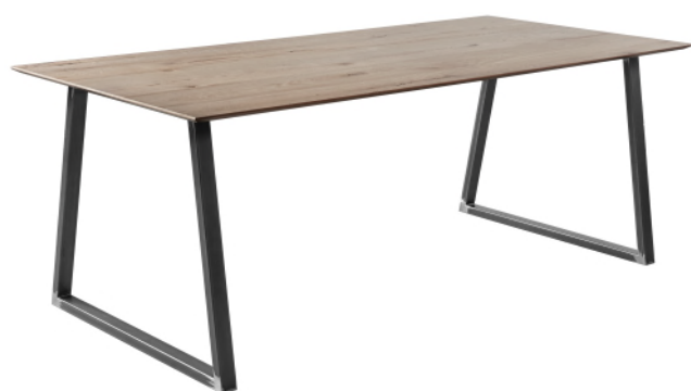
018/022 Eettafel H75 x B90 x L180 cm H75 x B90 x L220 cm