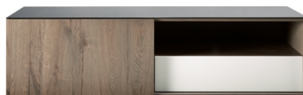
141 TV-Dressoir H49 x B180 x D50 cm