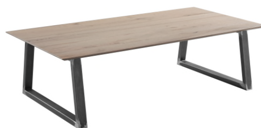
014/012 Salontafel H40 x B70 x L140 cm H40 x B70 x L120 cm