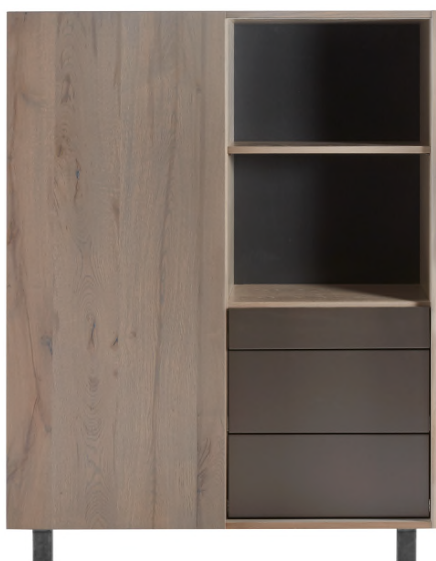
912 Bergkast H139 x B111 x D50 cm