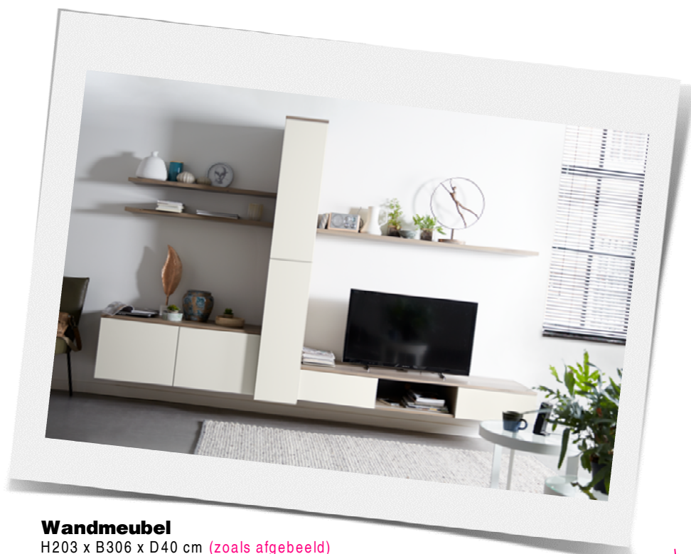
Wandmeubel H203 x B306 x D40 cm (zoals afgebeeld)

Het wandmeubel is samen te stellen uit losse onderdelen