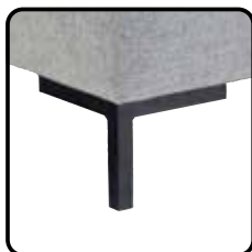
MF1 H15cm zwart (standaard)

Optioneel tegen meerprijs is dit model te bestellen met een zwart metalen frame.