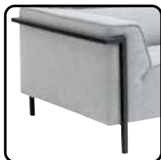
MR1 H15cm zwart (optie)