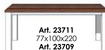
Art. 23711 77x100x220 Art. 23709 77x100x190 Art. 23710 77x90x160