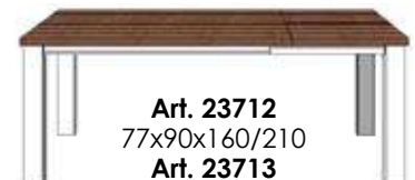
Art. 23712 77x90x160/210 Art. 23713 77x100x190/250 Art. 23949 77x140x140/190