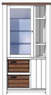
Art. 23945 200x105x40