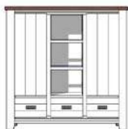
Art. 23950 140x140x45