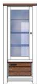
Art. 23946 159x68x45