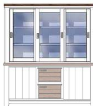
Art. 23947 (+23700) 119x185x36,5