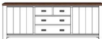
Art. 23716 86x240x45