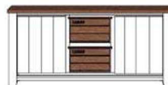
Art. 23700 86x185x45