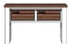
Art. 23948 77x40x122