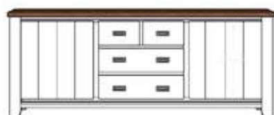
Art. 23701 86x220x45