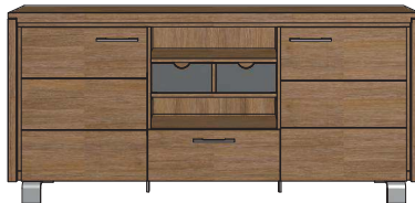
Art. 29161 86x180x42