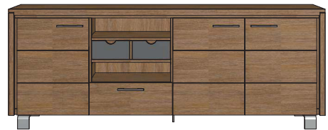
Art. 29160 86x220x42