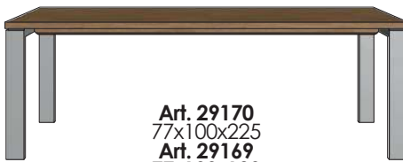
Art. 29170 77x100x225 Art. 29169 77x100x190