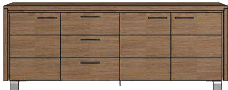
Art. 29178 86x220x42